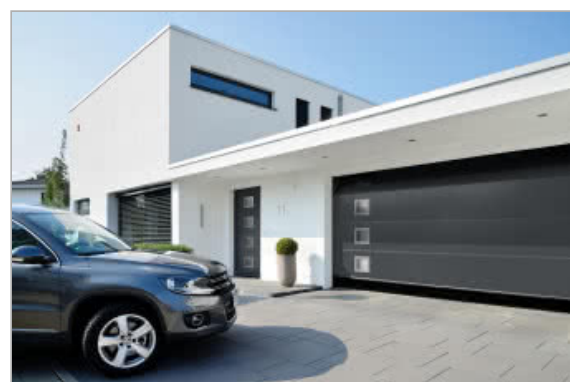
Złoty Laur Konsumenta 2019 dla firmy Hörmann