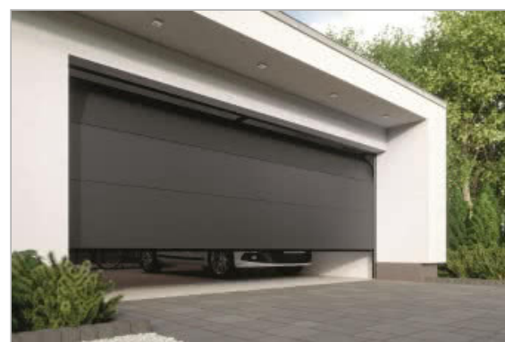
Złoty Medal Targów Budma 2019 dla Fakro za bramę BSS Supreme